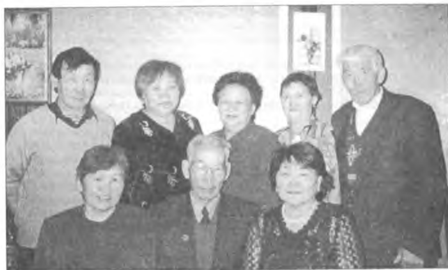
В.В.Ушницкайы кытта көрсүнүү үөрүүтэ. 2004 с.