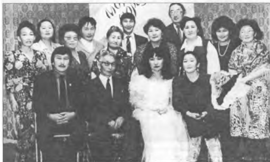
“Мороду моргуора” кинигэ презентацията