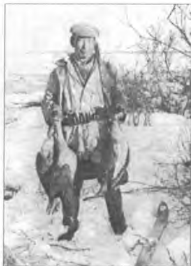
Лайыллаҕа (Өлөөкө Күөл) магнайгы хаастар