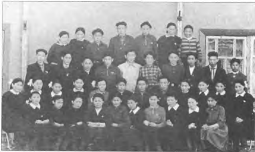
Өлөөкө Күөл оскулатын комсомолцтара. 1964 с.