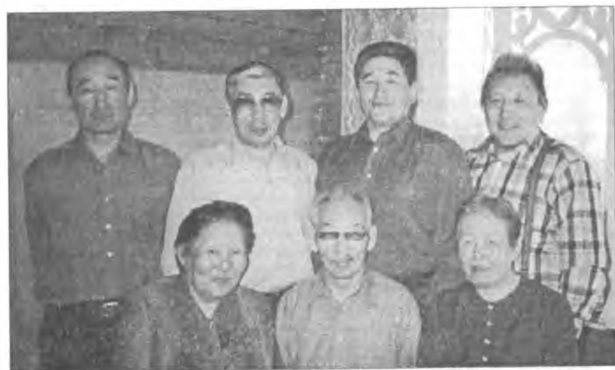
Сааһыран баран көрсүү — ордук күндү. 2005 с.