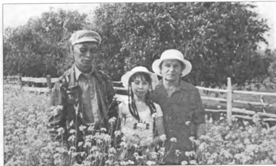
Василий Васильевич, Эльви Давыдовна Ушницкайдар сиэннэрэ Лераны кытта