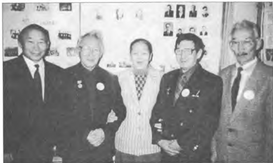
Поэттары, суруйааччылары кытта. Хамабатта