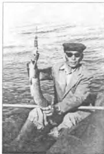
Балыктааһын (Балык суобар сордонг да бабалаах...)