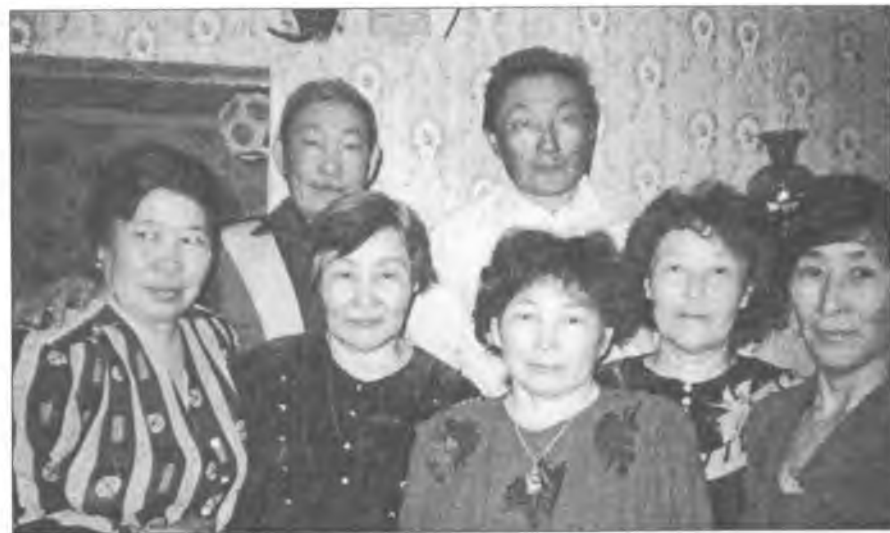
Бииргэ үөрэммиттэр. 1999 с.