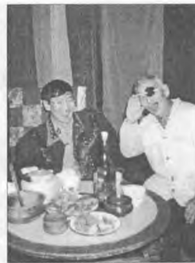
Кулууп сценатыгар. Хамаҕатта