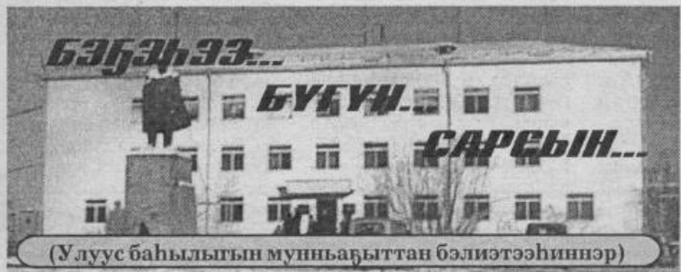
(Улуус баһылыгы мунһабыттан бэлиэтээһиннэр)

2001 с. Алтынньы 11 күнэ чэппиэр № 117 (8960)