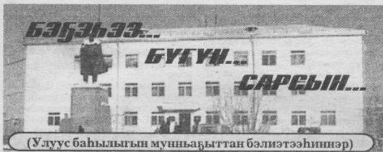
(Улуус баһылыгы мунһабыттан бэлиэтээһиннэр)

2001 с. Ыам ыйын 12 күнэ субуота № 53 (8896)