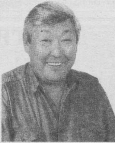
Онон туһааннаах сокуоннар көдүүстэ-эктик үлэлэтэхтэринэ уонна былаас по-литическай волята кыттыстаҕына, рес-публика бюджета итини уйунар кыахта-ах.

Ветераннар уонна инбэлииттэр, оҕолоох ийэлэр республика былааһын өттүттэн болҕомтону уонна кыһамны-ны көрсүөхтээхтэр. Республикага кыһа-лбаа түбэспит, көмүскэли көрдүүр хас биридии киһи, бюрократическай систе-маттан босхолонон, аадырыстаах көмөнү ыһахтаах.