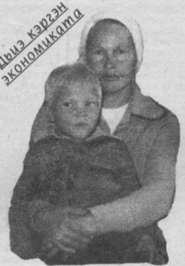
Дьээ кэргэн экономиката