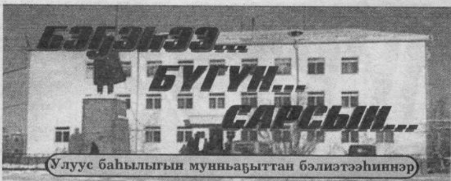
Улуус баһылыгын мунһабыттан бэлиэтээннэр

2001 с. Кулун тутар 15 күнэ чэппиэр № 30 (8873)