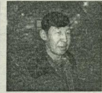
Мин мастерскойга төрдүс сылбын үлэлибим.

Аппааны бөһүөлгэр 7 км. устаах араас диаметрдаах газопровод турбатын сваркалаан, экскаваторынан траншеятын хаһан түһэрбиһит. 150 ыалга айылда гааһын киллэрбиһит. Онтон кэлин сылларга Салбан бөһүөлгэр 93 ыалга гааһы умалпыппыт, онтон Аппааны бөһүөлгэр салгы үлэлээбиһит. Нам сэлээннэтигэр Сэргэлээх, Молодежнай, Заложнай уулуссаларга газопровод түбэрбиһит уонна дьиз-эргэ гааһы киллэрбиһит. Итини тэнэ бэйэбитигэр аروحнай гарааһы, мастерскойу туппуппун. Рабочайдарбытыгар 4 киһиэхэ уһаайба ылан биэрэн дьиз туттубуттара. Салгыны Граф Бизрэгэр ГРП-ны оҥорбуппун уонна квартальной котельнайга, 17 ыалга гааһы киллэрбиһит.