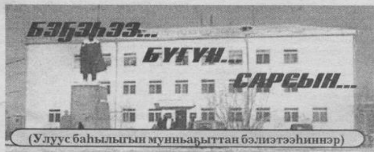
(Улуус баһылыгы муньабыттан бэлиэтээһиннэр)

2001 с. Муус устар 19 күнэ чэппиэр № 46 (8889)