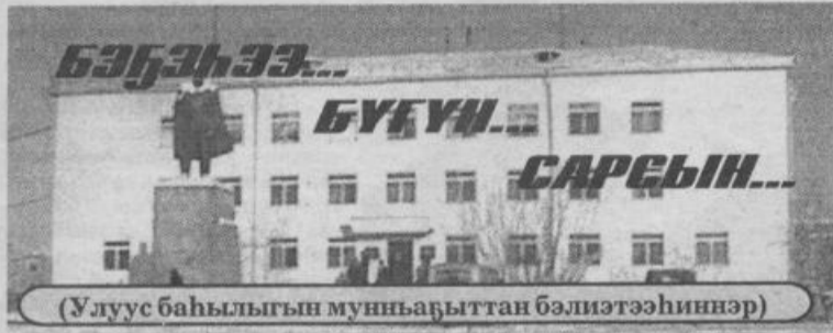
(Улуус баһылыгы муньабыттан бэлиэтээһинэр)

2001 с. Атырдыах ыйын 2 күнэ чэппиэр № 87 (89130)