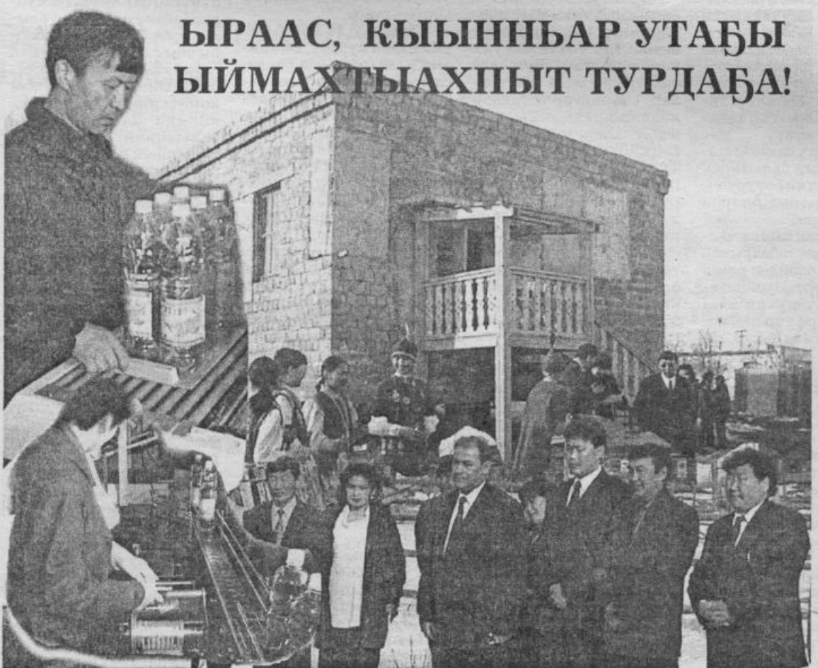
Үөдүйгэ газированнай утагы кутар сыах үлэтин саҕалааһынын үөрүүлээх түгэнэ. И. Сивцев коллажа