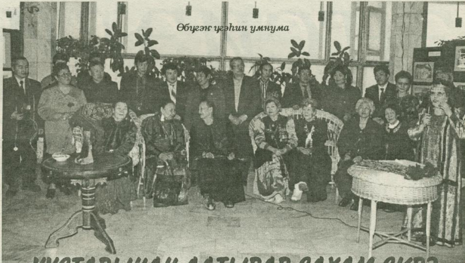
Өбүгэт үгэһин умнума