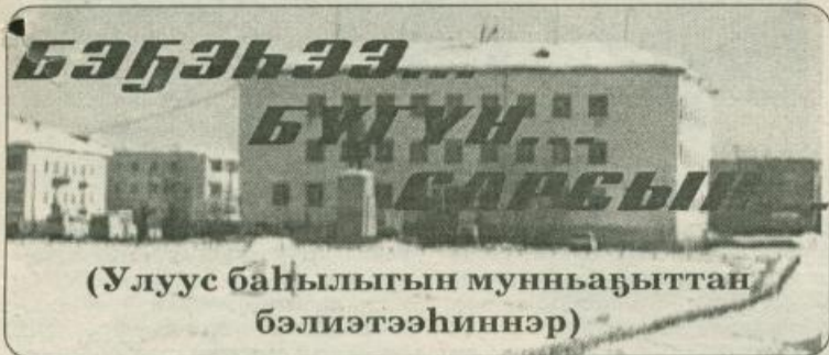
(Улуус баһылыгы мунһабыттан бэлиэтээһиннэр)

• Нам улууһун хаһыата • 1935 сыл алтынны 5 күнүгэр төрүттэммитэ •