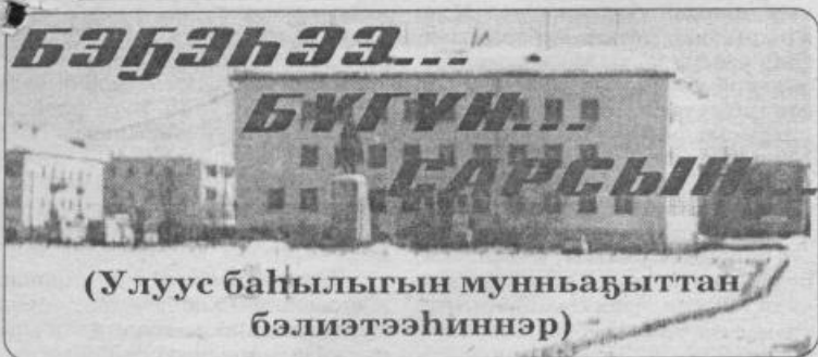
(Улуус баһылыгы муньабыттан бэлиэтээһиннэр)

Бал экономикатын сайыннарыга кэлбит кредиткэ Нам селотугар 300-тэн тахса сайабылыанна киирбитэ бэлиэтэммит. Дьон сүрүннээн сүөһү, сылгы атыылаһабыт дьон матыһтыыллар эбит.