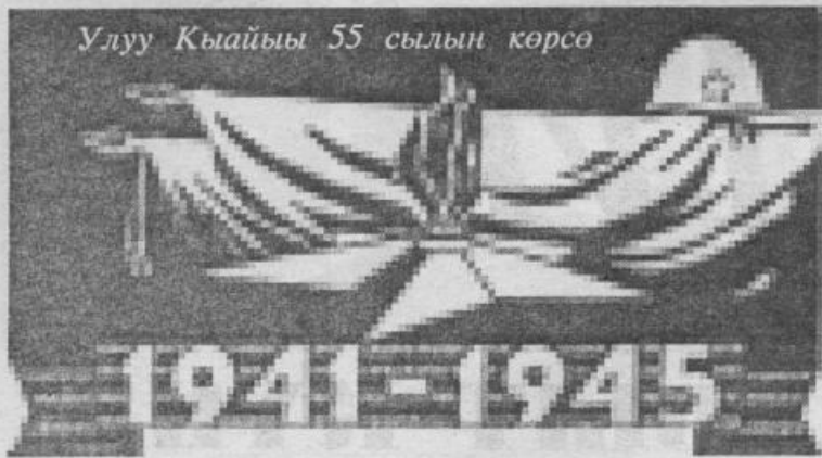
Улуу Кыайыы 55 сылын көрсө