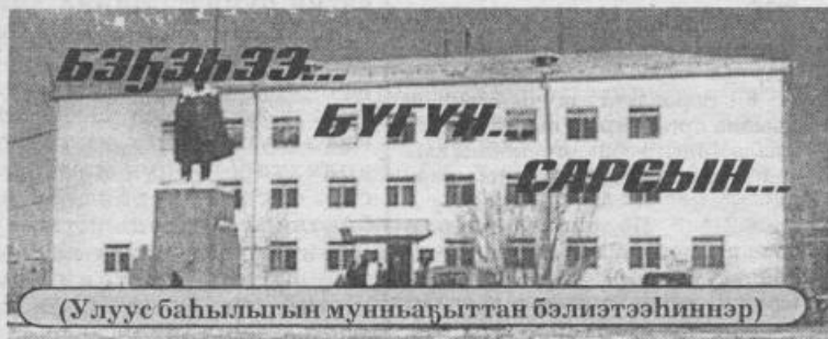
(Улуус баһылыгы мунһабыттан бэлитээһиннэр)

2001 с. Алтынны 25 күнэ чэппиэр № 123 (8966)