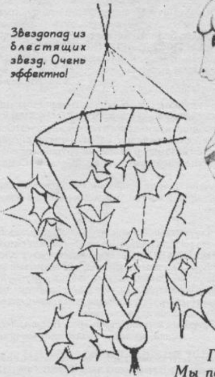
Звездочка из блестящих звезд. Очень эффектно!