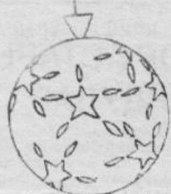
На разноцветные воздушные шары приклеить снежинки, елочки. Смотрится очень красиво.

ДЕВОЧКИ придут в восторг от красивой небольшой куклы. Банально, но беспроборно подарить большую мягкую игрушку.