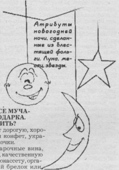
Атрибуты новогодней ночи, сделанные из блестящей фольги. Луна, месяц, звезды.

Мы поздравляем Вас с наступающим Новым годом и дарим Вам нашу подборку новогодних материалов, специально подготовленную для Вас! Надеемся, что это вам пригодится в новогодние и Рождественские праздники. Ученики 10 «а» класса Намской средней школы № 2