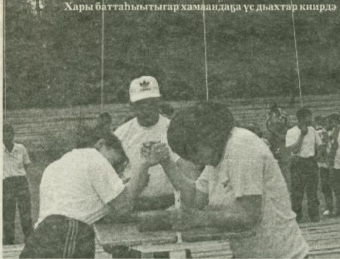
Хары баттаһыһыһа хамаандаҕа үс дьахтар киирдэ