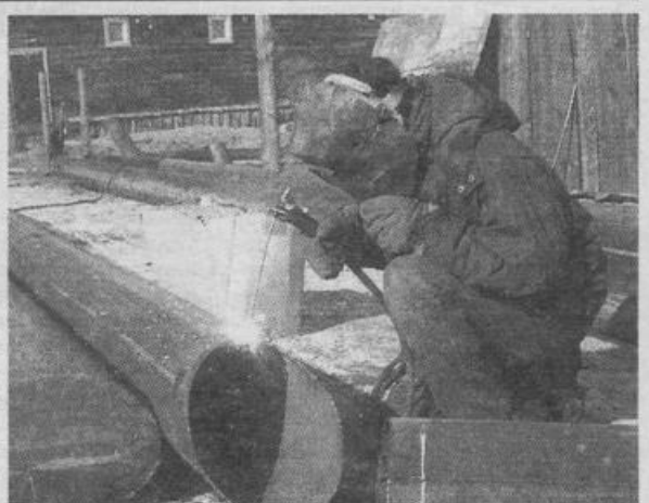
Ититэр система хорук магистралларын турбалара олуһун эргэрдилэр. Быйылы кыһыны билгэлээһин кытаанах. Выстах өрөмүөн оһон-манан чытылыннабына да бытарҕан тыһынылар түстэхтэринэ олоһбут тулуйаллара саарбат...