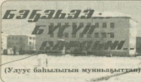
(Улуус баһылыгы мунһабыттан)

2000 с. Атырдык быйын 3 күнэ чэппиэр № 87 (8777)