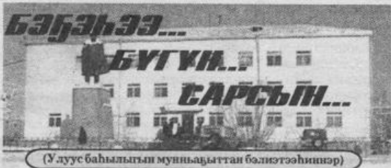
(Улуус баһылыгы муньааҕыттан бэлэтээһинэр)

Нам улууһугар буолбут баһаарынай сулууспа үлэһиттэрин республикатааҕы спартакиадагы барыта 151 киһи кыттыһыны ылбыт. Алта улуус кыттыбытыттан уусалданнар 1-кы, намна иккис миэстэни ылбыттар.