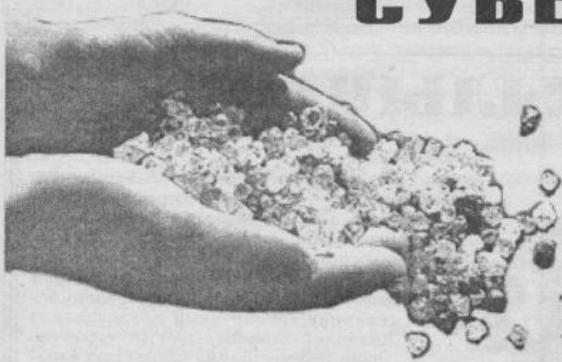
Саха Республикатын суверенитетын 10 сылын көрсө

кортостан, Татарстан республикаларын суверенитетке уонна бэйэни быһаарыныга, республиканскай законодательстволар уһугулаан турууларыгар, аан дойдутаагы сыһыаннаһыларга самостоятельноска уонна айылҕа ресурстарын бас билиигэ сыһыаннаах конституцияларын сорох балаһыанналар конституционнойнаа суоһун туһунан быһаарыны таһаарда. Ити күн республика прокуратура законодательной инициатива быһытынан республика суверенитетын туһунан 1 чаас 1 ыстатыйатын уонна республика айылҕа ресурстарын бас билии туһунан 5 ыстатыйаны РФ Конституциятыгар сөп түбэһинэрэн, уларытарга модьуйан, «СР Конституциятыгар уларытылары уонна эбиилэри киллэрэр туһунан» СР Сокуонун бырайыагын киллэрдэ. Итиннээх РФ Конституционной суутун Алтай Республикатыгар 2000 сыл бэс ыйын 7 күнүгэр таһаарыт уурааһар олоһурда. Оттон 2000 сыл бэс ыйын 27 күнүнээҕи РФ Президенин «РФСР уонна РФ Президенин сорох ыйаахтара күүстэрин сүтэригэртин биллэрэр туһунан» 1191 №-дээх Ыйааҕа билиги республикабытыгар сыһыаннаан, итиннээх этиллибиттэри «чопчу ис хоһоонноото».