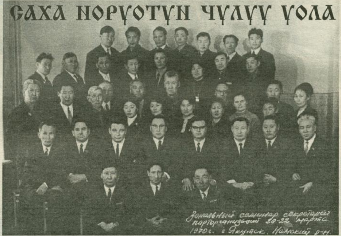
Зонал үлэтиги салинар секретарэ парторганизаачи 20-22 марта 1970г. г Якутск. Намский р-н.