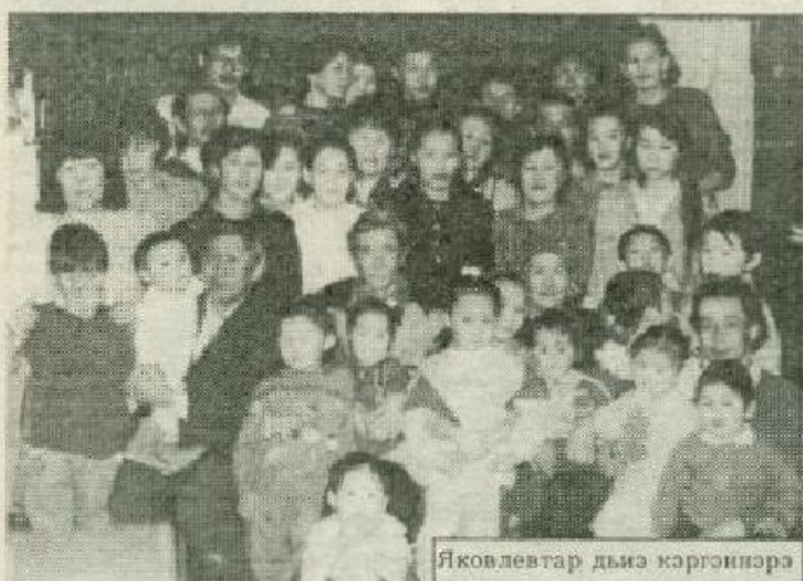
Яковлевтар дыңы көргөннэрэ

Удэй нэһилиэгэ улууска, республикада элбэх Герой-ийэлэрдээбинэн биллэр. Бу кыра нэһилиэксэ 13 Герой-ийэ олорон, үлэлээн кэллэ. Билигин сорохторо суохтар тынан баран кинилэр олохторун оҕолоро, сизинэрэ салгыһылар. Мин кинилэр тустарынан 1997 с. «Кыям» хайыаака А.Я. Семёнованын улахан ыстатыйа бачээттэтээн турабын. Быһыл икки үйэ кирбиитин салгыгар кинилэр тустарынан улуус хайыаагыгар эмизэ баллиэтээн ааһыахпыт баҕардым.