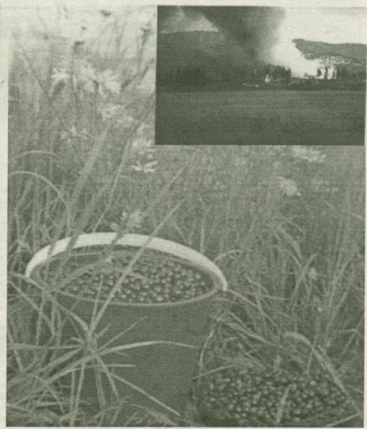
Айылда бэлэһин хомуйаргытыгар уоттан ураты сэрэхтээх буолун! Иркутскай уобалаһыгар киһи өтөрүнэн билбэтэх улахан баһаара бараттарын киһи телевидениеттан көрбүт-истибит буолуохтааххыт... Хара тыабыт — бэйэбит баайыт — хараххыт харатыныны харыстаан!