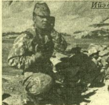
Ийэ дойдуну көмүскээһин — ытык эбээһиһэ

Сибидиһиһэлэри Е.П. Иванова эбэн киллэртэрдэ