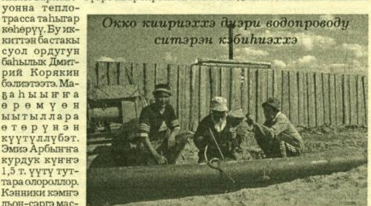
Окко кириэхтэ дьэри водопроводу ситэрэн кэбиһэхтэ