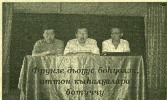
Фрунзе дьобус бөһүөлэ, оттон кыһалҕалара ботуччу