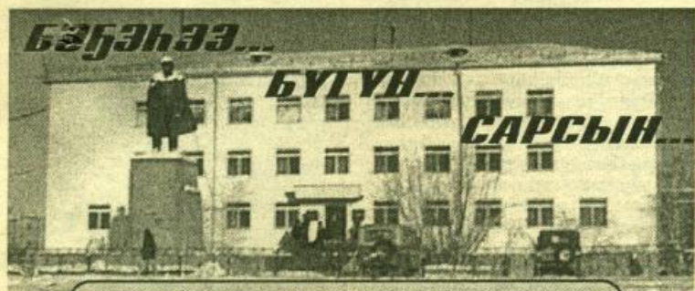
Улуус баһылыгы мунһабыттан бэлитээннэр

2003 с. От ыйын 17 күнэ чэппиэр № 86 (9248)