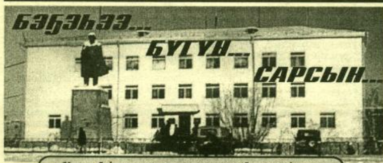
Улуус баһылыгы мунһабыттан бэлэстээһиннэр

Айылга харыстабылын инспекцията ааспыт субуоталаах баскыһыаннаа Таастаахха тахан рейдэлэтэ. Кус көгүлүн иннинэ элбөх киһи маасабайдык сааланан түбөстилэр. Хатырыкка, Модукка, Граф Бизергэр көгүлү суох балыктаабыт дьон тугулуунулар уонна ыстарааптаннылар.