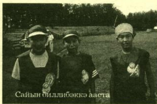
Сайын биллибөккө ааста