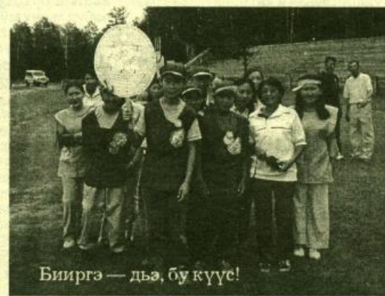
Бииргэ — дьэ, бу күүс!