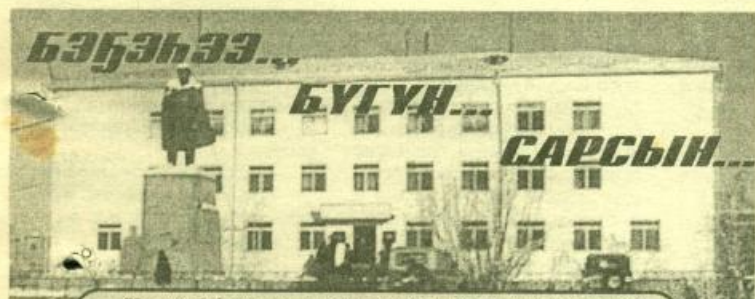
Улуус баһылыгын мунньабыттан бэлэтээһиннэр

2003 с. Ахсынньы 11 күнэ чэппиэр № 154-155 (9318)