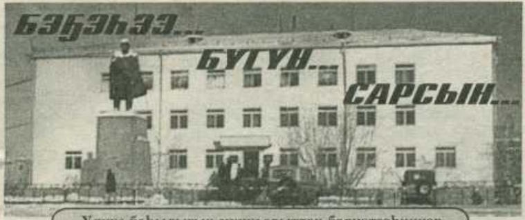
Улуус баһылыгы муньабыттан бэлиэтэниһэр

2002 с. Ыам ыйын 16 күнэ чэппиэр № 59 (9054)