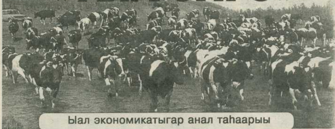
Ыал экономикатыгар анал таһаары