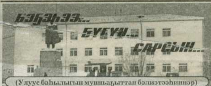
(Улуус баһылыгытын муньадыттан бэлиэтээһиннэр)

ИДЬУО личнэй састааба быыбар күн актыбынайдык үлэлээбит. Бу күн бэрээдэги кэһии тахсыбатах. Бырааһынныктыгар уонна быыбарынан сибээстээн ДИД-га тахсы молтох, ол курдук, ааспыт нэдиэлэр икки эрэ тэрилтэ тахсыбыт.