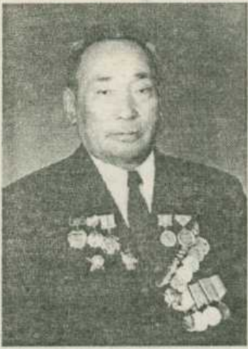
Кизн туттар дьоммут — биһир дойдубулаахтарбыт