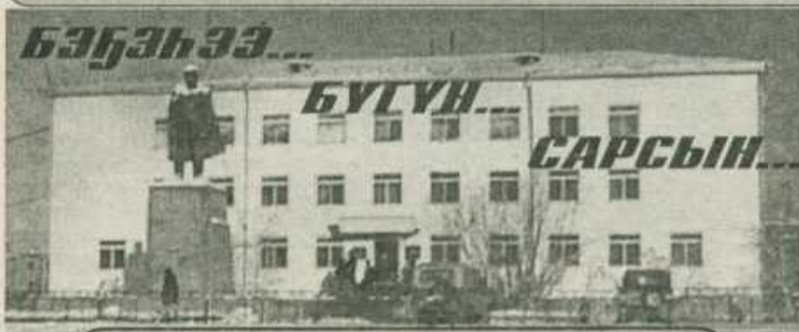
Улуу баһылыгы муньабыттан бэлиэтэһиннэр

«ЭНСИЭЛИ» хаһыакка суруттуу түмүктэнэрэ 5 эрэ күн хаалла!