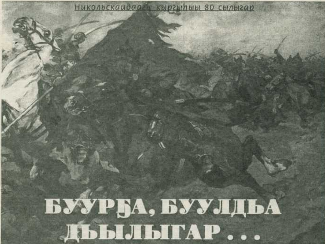
Никольскайдаагы кыргызыны 80 сылыгар