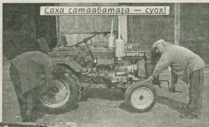
Саха сатаабатага — суох!

Хатын Арыы нэһилиэгэр Кытай дьонус трактордарын таһыһы саҕалаатылар. Бу үлэни саҕа тэриллит «Нам» ХЭО машиннай-технологической станциятыгар оҕороллор. Тэрилтэ салайааччыта Г.Г. Марков нэһилиэк дьаһалтатын өйбүлүнэн «Туймаада-лизинг» ГУП кытта «Синтай» трактордары лизингынан ыһахтаах дьонго тиксэриллэн иһиннэ таҕан бэлэмнииргэ дуоҕабар түһэрситтэр. Ол чэрчитинэн бэс ыйын 13 күнүгэр Аппааны мастерскойугар 90 тракторы тийээн аҕалыттарыттан бэс ыйын 20 күнүгэр номнуо 30 тракторы таҕан бүтэрибүтэр. Уопсайа 94 трактор оҕоһулуохтаах, онно КСФ скоростной косилка көтөрдиллэр. Үлэлэрин от