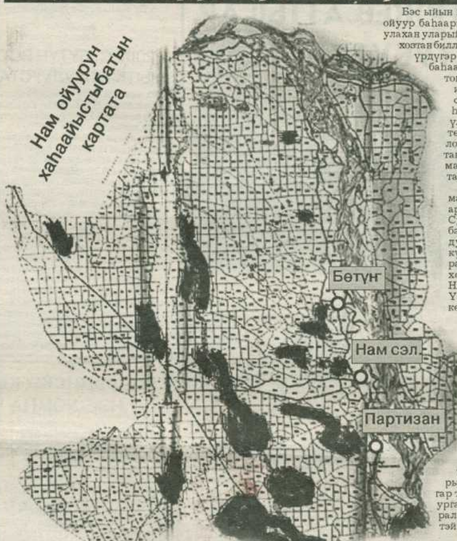
Картаҕа баһаар буола турар сирдэрэ хара өгүнөн бэлиттэннилэр.

Бэс ыйын 26 күнүгэр улууска ойуур баһаарын харгыһынаагыра улахан уларыһы тахсыбата, лесхозтан биллэрбиттэринэн Модут үрдүгэр Бэтэксэнгэ турбут баһаарга тахсыбыт дьонтоҥ сибидиэннэ киирө илик Парашютистар солбуһа-солбуһа баһаары умуроорууга үлэлиллэр. Сиркомитетиттан уонна экология инспекциятыттан Искраҕа быһыһымайгыны билсэ тахсыбыттар.