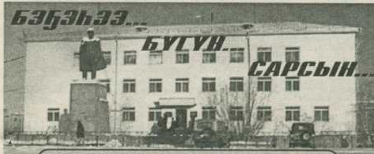
Улуус баһылыгы муннабыттан бэлиттээһиннэр

2002 с. Бэс ыйын 27 күнэ чэппиэр № 76 (9070)