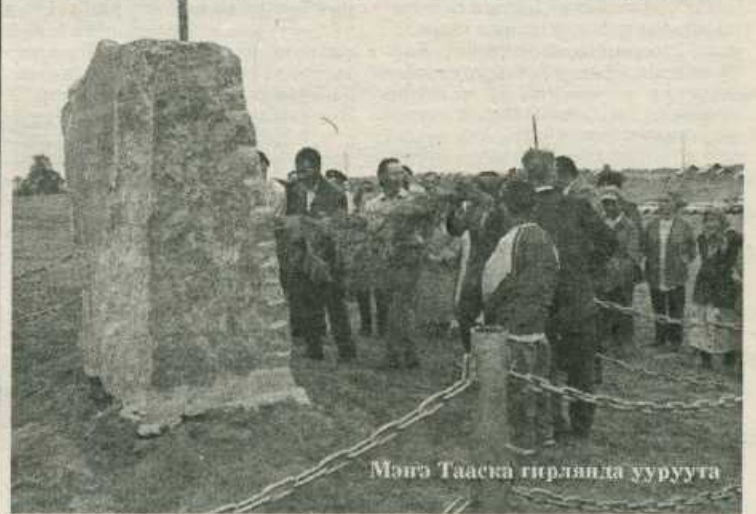
Мэҥэ Тааска гирлянда уурууга