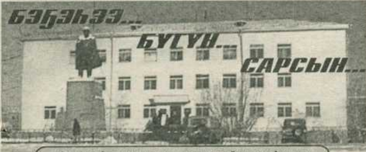
Улуус баһылыгы муньабыттан бэлитээннэр

2002 с. Ыам ыйын 30 күнэ чэппиэр № 65 (9060)