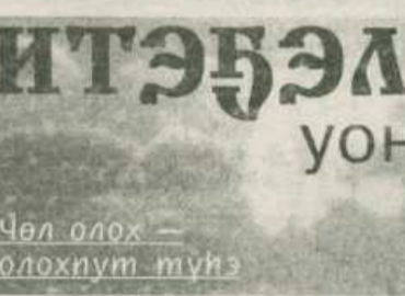
Чөл олох — олохтун тиһиэ

киһиниир киһи халлаан куйаарыгар олох кыра, туораах эрэ саға буоллаҕа дикэ. Ол быһыыһаан сир айылгатын оҕолор биэр танара айыыларга буоллаҕына эбээт. Олору Урдук Мэҥэ Халлаанга олоһор соҕотох Танарабыт салаһа сатаан эрдээт. Ону кыайан өйдөбөккөбүт