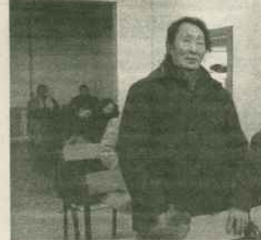
Муньахтарга кырдыаҥастар — «штатнай араатардар», эдэрдэр кэлин эрээттэргэ онуоха-маныаха дьэрэн саҕата суох олороллор. Хаһаанга дьэрэл...

көтүгүллүбүт буолаҕына улуус дьаһалтата итэр-өйдөтөр, нэһиликтэрин кытта үлэ дьаргытыыны таһаарыт нэһиликтэр дьаһалтатын сирэйдээн-харахтан соруку туруоран утумнаах үлэ тэриллэригэр хамсааһыны оноруу дьэн эрэл үөскэтэр.