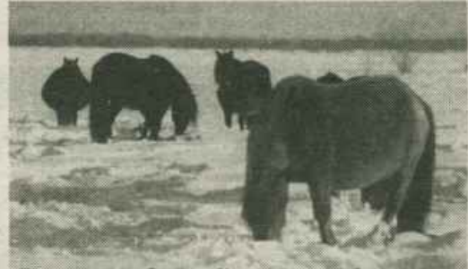
Тыа хаһаайыстыбатын биэрэпиһэ

Россия курдук улуу государство тыа хаһаайыстыбатыгар тираждэринэ эрэнники сайдар кыахтаах. Онон биэрэпис түмүктэрэ быһаарар оруолу ыллаллар.