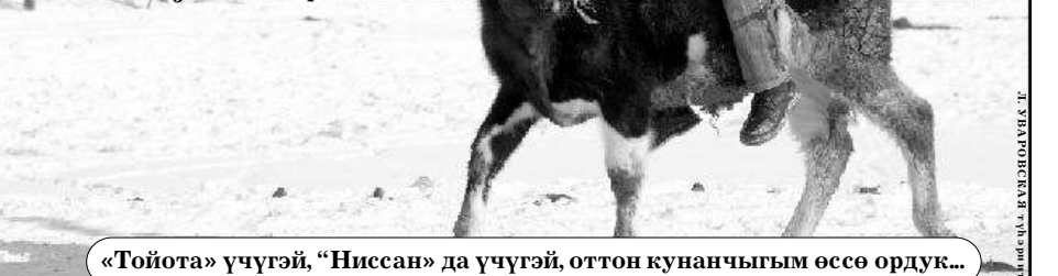
«Тойота» үчүгэй, «Ниссан» да үчүгэй, оттон кунанчыгым өссө ордук...

Бу көрөр хаартыскаҕыгар кэнники сылларга улууска бастакынан оһуу сүүрдүүнэн дьарыгыран эрэр Модут нэһилиэтин оҕото көстөр.