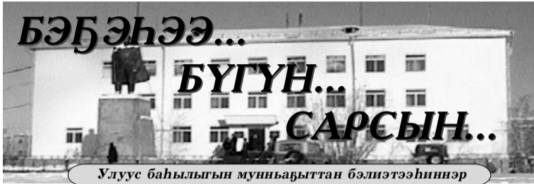
Улуус баһылыгы мунһабыттан бэлиэтээһиннэр

1996, 2005, 2009 сылларга республика басты хаһыата