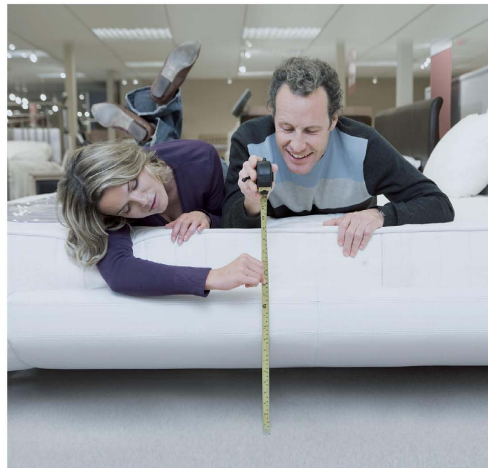
Представитель принимает по адресу ул.И.Винокурова 3, ТЦ "Ассоль" тел:(41162)41599

Когда вы чувствуете, что проще взять кредит, чем копить на покупку, обращайтесь в Росбанк. Фиксированная процентная ставка без скрытых комиссий позволяет заранее установить размер выплат по кредиту и четко спланировать расходы. Никаких неожиданностей!