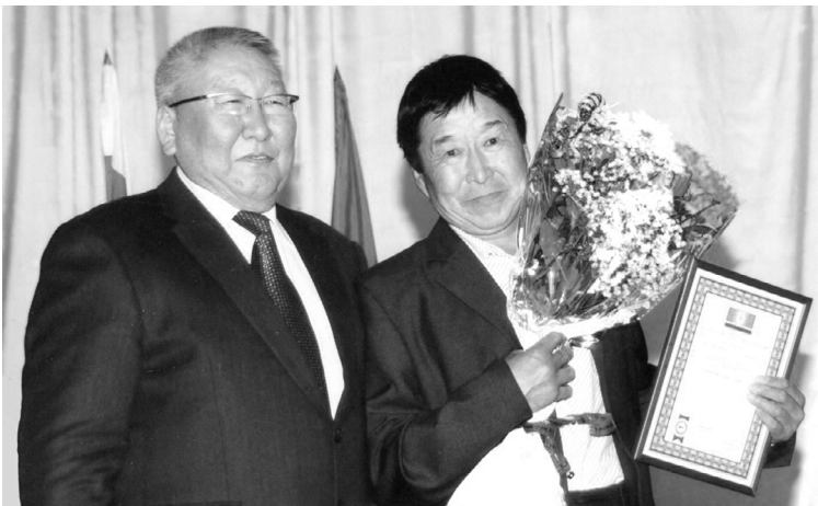
Россияҕа онгоһуллубут 3 котелтигэр сэмэй кылааттарын киллэртүрбүт. Горелкалар, электробит, күүскэ үлэлээбит, үлэлэспит

Котельнай дьардыамата швеллернэй каркастан туруорулунна, истиэнэтин матырыйаала корейскэй технологиянан Саха сиригэр онгоһуллубут. Котельнай саалатыгар «Турботерм-1000» диэн итальянскэй технологиянан