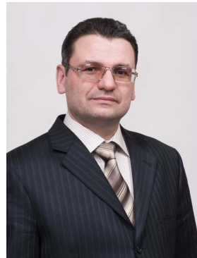
ГАВРИЛ ПАРАХИН — НАШ ДЕПУТАТ!

(«РФ Федеральной Муньаһын Государственной Думыны Депутаттарыны быһыарын туһунан» ФС 59 ыст. сөп түбэһиннэрэн «Россия либеральной-демократической партията» ПП Саха сиринээри региональной салаата кыттылыах сэрэбиэти бэрээдэгэр олохторун босхо бэчээттэннэ)