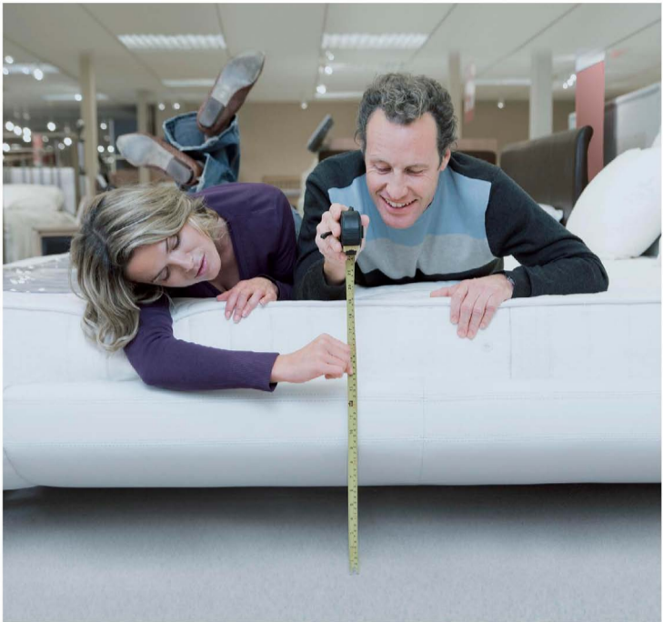
Представитель принимает по адресу ул.И.Винокурова 3, ТЦ "Ассоль" тел:(41162)41599

Когда вы чувствуете, что проще взять кредит, чем копить на покупку, обращайтесь в Росбанк. Фиксированная процентная ставка без скрытых комиссий позволяет заранее установить размер выплат по кредиту и четко спланировать расходы. Никаких неожиданностей!