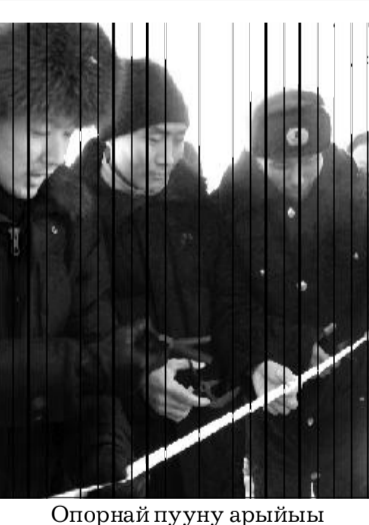
Опорнай пууну арыһыы

Ынах сүөһү ахсаана улаханньк хамсаабакка турар. Ол гынан баран кэп-сэтэн көрдөххө эдэр ыал-лар, бааһынай хаһаайыс-тыбалар ыанньык ынаҕы элбэтэр баҕалаахтар. Ол эрээри тыа сиригэр харчы кырыымчыгынан кинилэр элбэх сүөһүнү атыһылаһар кы-ахтара суох. Сайынны өттүгэр үүт туттаран, кыһынны оҕо по-собиеһынан, дьиз кэргэнгэ биер үлэһит хамнаһынан, пенсиянан ииттинэн олоһоллор. Онтон мин правительствоттан, тыа хаһа-айыстыбатын министерство-тыттан сана хаһаайыстыба тэ-риниэн баҕалаахтарга, бааһы-най хаһаайыстыбаларга тингэһэ ынах буолар сүөһүлэригэр чэп-чэтиилээх субсидия, 3-5 сылга кредит көрүллэрэ буоллар дьиз көрдөһүөхпүн баҕарабын. Бый-ыл бэйэбитигэр кыра убойнай сыах уонна эт астан полуфабри-кат онорор сыах тэрийэр была-