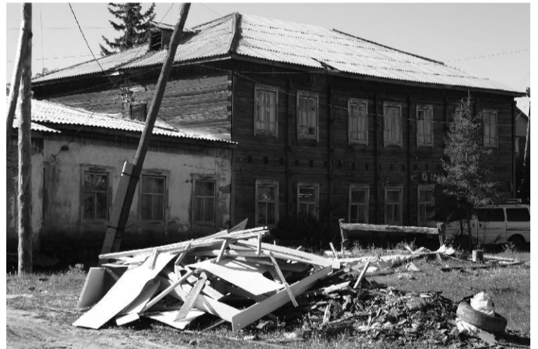
«Быткомбинат» дьизэтэ. Манна дьобуус да буоллар, өгөнү онгорор хас да тэрилтэ үлэлиир. Ол гынан баран тиэргэннэригэр наадый-баттара хомолтолоох. Ааранан, бу бөх-сыыс пенсионнай фонда Намнааҕы управлениетын дьизэтин көстүүтүн буортулуур.