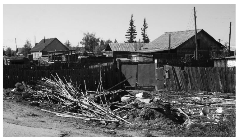
Ленскэй уул. 22. Көрдөххө, тиэргэн хаһаайыттар бадарааннаах, уу олохсуйар сир тупсаараары араас бөҕү-сыыһа аҕалан купууттара свалкаҕа майгылыыр. Ол уулусса уопсай көстүүтүн олус буортулуур.