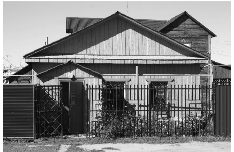
«Коника» фотосалон. Өрүү ыраас, сибэккинэн симэммит тиэргэннээх. Хаһаайыттар дьон сылдьалларыгар бары усулбууяны тэрийбиттэрэ биһирэнэр.