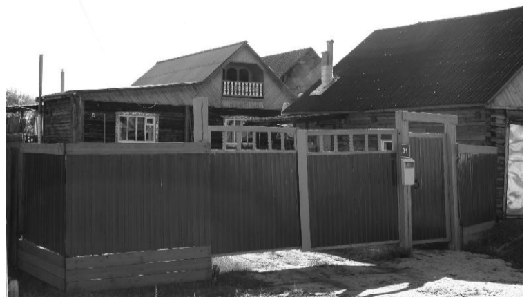
Ленскэй уул. 31. Тупсаҕай оҕоһуулаах олбуору, дьизэ түннүктэрин, мансаардатын кыраһыабай оһуора-мандара ситэргэн-хоторон биэрэр.