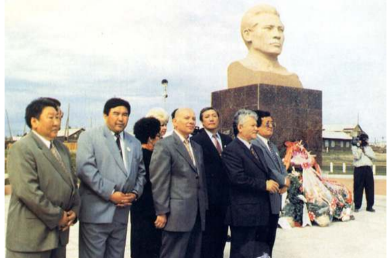
Руководители Республики Саха (Якутия) и делегация Республики Кыргызтан на юбилейном ысыахе Намского улуса, посвященном 100-летию М.К. Аммосова.

графии папы написано: «Родился около 23-го ноября (понедельник) 1897 года (день рождения по данным родителей не сходится с метрической выписью, указанной выше)». В нашей семье при жизни мамы день рождения М.К. Аммосова отмечался 28 ноября. По последним найденным работниками Якутского архива