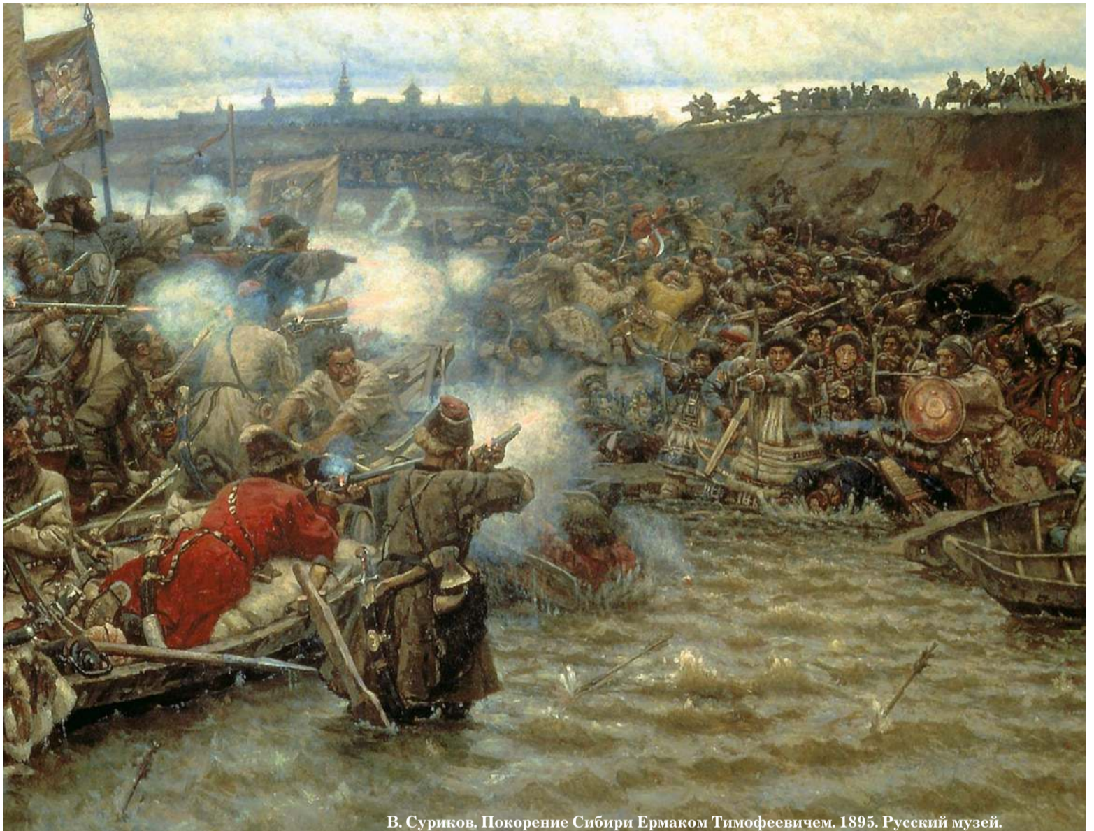
В. Суриков. Покорение Сибири Ермаком Тимофеевичем. 1895. Русский музей.