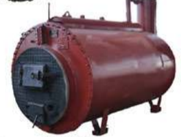
Котел KB-300 Работает на Твердом, Газообразном и Жидком топливе