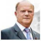
Зюганов Г.А. КПРФ