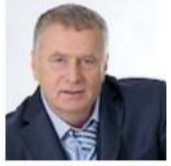
Жириновский В.В. ЛДПР