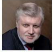
Миронов С.М. «Справедливая Россия»