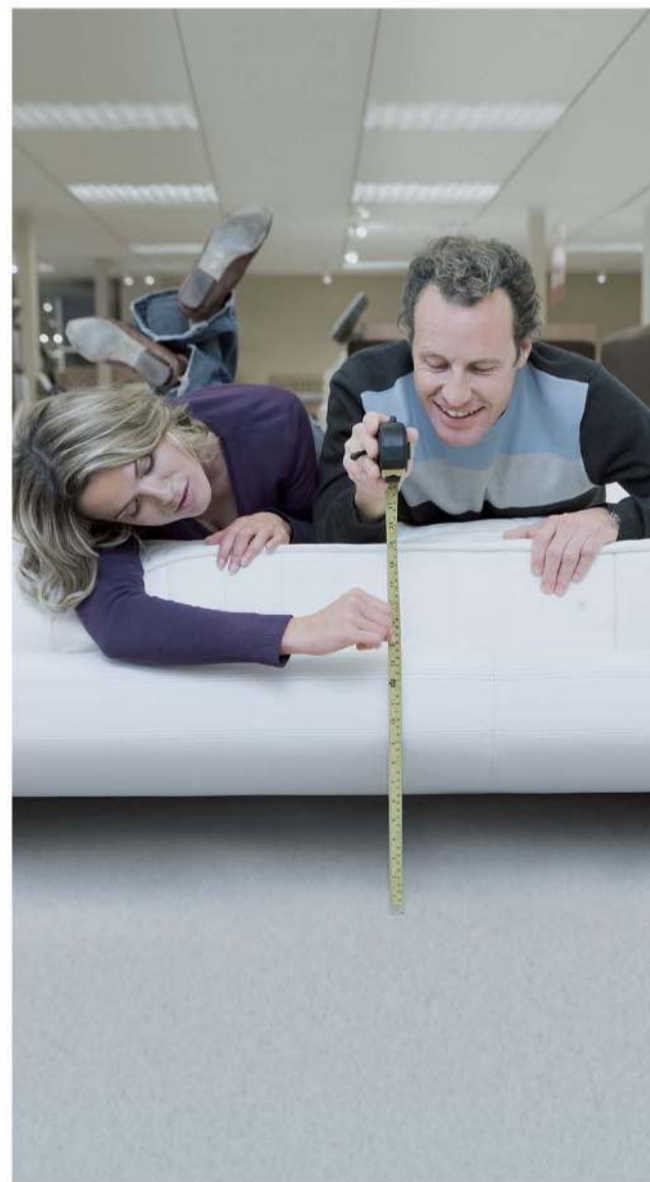
ОАО «РОСБАНК». Группа Сосьете Женераль. Реклама.

Фиксированная процентная ставка без скрытых комиссий позволяет заранее установить размер выплаты по кредиту и четко спланировать расходы. Никаких неожиданностей!