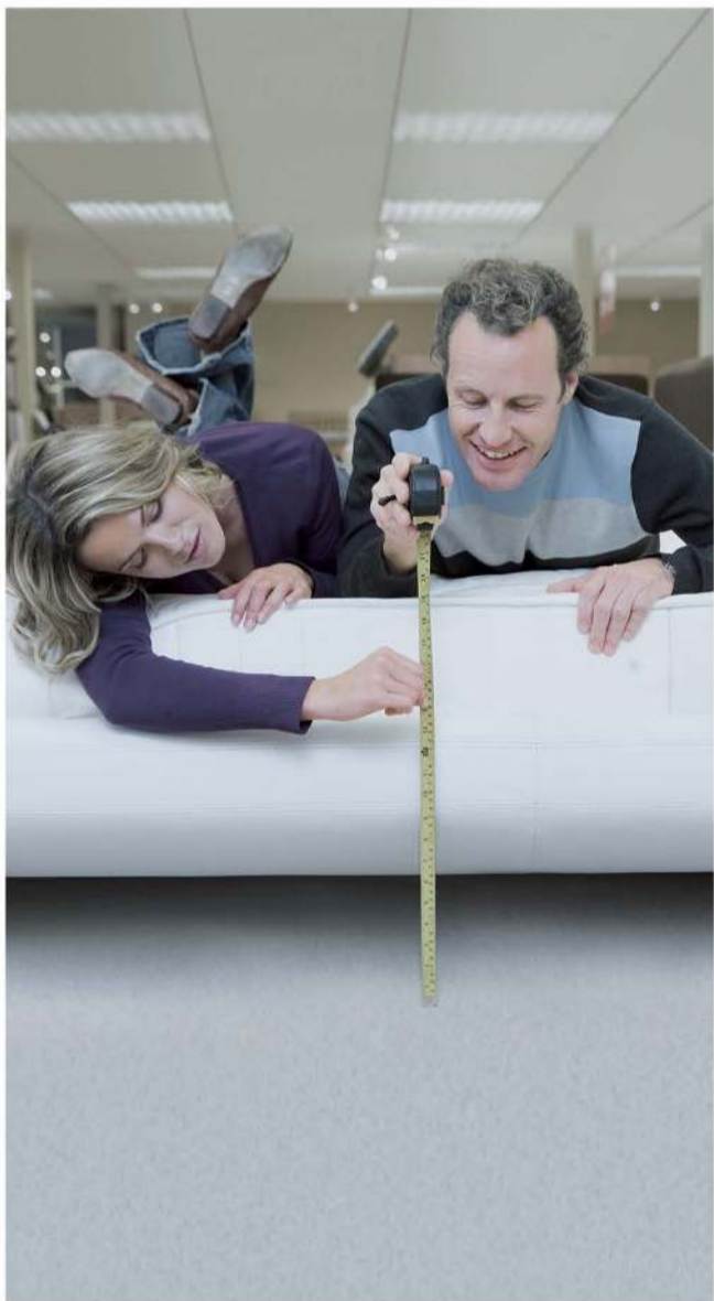
ОАО АКБ «РОСБАНК», Группы События Жизнедеятельности, Рязань

Когда вы чувствуете, что проще взять кредит, чем копить на покупку, обращайтесь в Росбанк. Фиксированная процентная ставка без скрытых комиссий позволяет заранее установить размер выплат по кредиту и четко спланировать расходы. Никаких неожиданностей!