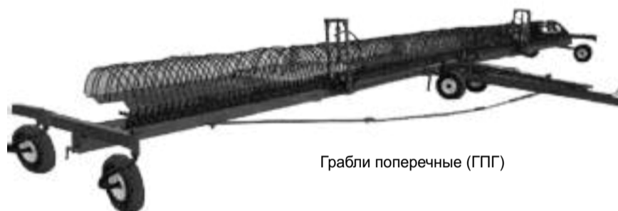
Грабли поперечные (ГПГ)