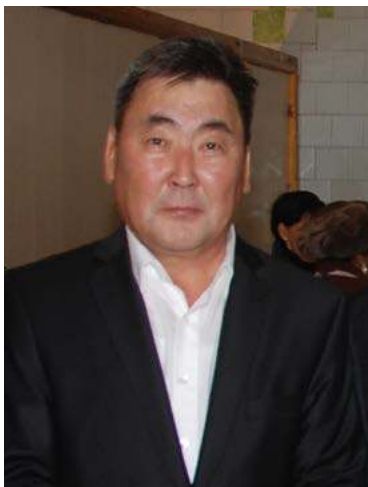
хаачыстыбата ураты ирдэбилгэ туруохтаах.

этэллэринэн т/х-гар дьайылылаах уларыйыы кирибэтэҕинэ 2020 сылга сүөһүнү көрөр киһи хаалыа суоҕа. Дьоммут кырыйдьлар, сүөһү көрүүтүгэр үс көлүөнэ дьон кэлбэттирэр. Иккиһинэн, Россияга улахан кризис саҕаланан ээр сибикилэр билиннилэр диян буолла. 2010 с. Америка ньиэби, гааһы атыылаһарын тохтоттобуна Россия улахан кризискэ кириэҕэ дииллэр. 90-с сылларынан өйдүүбүт: манньк балаһыанньаҕа бюджет