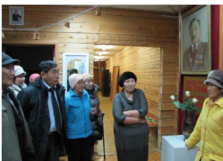
атынан, минньигэс алаадынан уонна да атын ас амтаннаабын

остуол хотойорунан тардан үөрөкөтө күндүлээтилэр уонна ир-