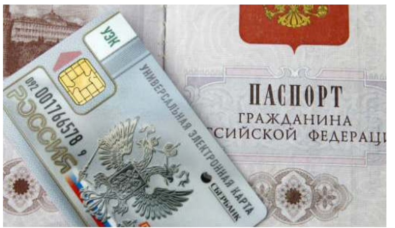
Универсальной электронной каарта – боруобалаан көрүү

пааспардары, биир каартага личность дастабырыанньатын уонна судаарыстыбаннай өҥөҕө универсальной күлүүһү холбоон, 2000 сыллар сагаланыларыгар бэйэтин олохтоохторугар биир бастакынан Сингапур киллэрбитэ. Малайзия каартатыгар идентификационной, банковскай, транспортнай сыһыарылар, массынаны ыгытыга быраап уонна медицинскэй информация кириэхтэрэ. Германияга Geldkarte судаарыстыбаннай уонна коммерческой өҥөнү туһанар уонна докумуоннарга электроннайдык илии баттыр кыагы биэрэр. Эстония ID-каартата личность дастабырыанньата буолар, уопастыбаннай транспорка айанныр виртуальной билиэти уурарга, Интернет-быбардарга идентификациялыырга туһанылар уонна Интернеткэ комментарийдарга уонна докумуоннарга илии баттыр кыах биэрэр электроннай илии баттааһыны илдэ сылдар.